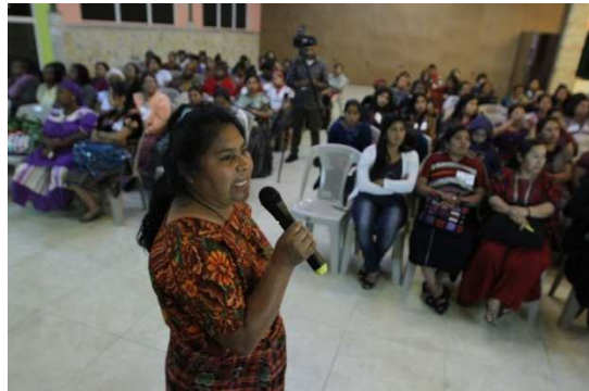
Lideresa maya interviniendo en el III Encuentro de Mujeres