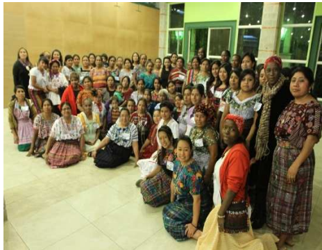
Participantes en el III Encuentro Nacional de Mujeres Mayas, Garífunas y Xinkas

El Programa Gestión del Desarrollo Cultural realizó 14 acciones entre talleres de capacitación, conversatorios, celebración de fechas conmemorativas a favor de la mujer en el calendario maya y un Encuentro Nacional de Mujeres Mayas Garífunas y Xinkas en Cobán, Alta Verapaz. Como producto de estas intervenciones, 683 mujeres indígenas y mestizas (de las cuales un 57 % habitan en municipios priorizados por el GEM) se informaron y capacitaron acerca de sus derechos humanos, los mecanismos para prevenir y atender cualquier forma de violencia contra la mujer y el contenido de las políticas vigentes que orientan el accionar de las instituciones públicas a favor del desarrollo integral de las mujeres.